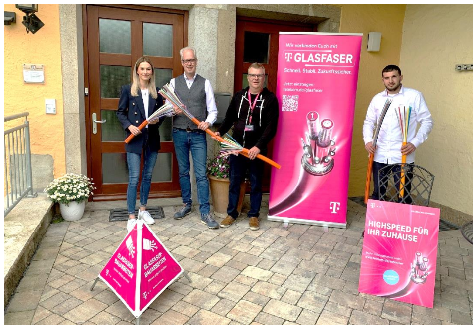
Start des Glasfaserausbaus auch im Hauptort Gebssattel