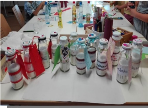
Bilder vom Ferienprogramm am 06.08.2018 im Rathaus, Schulstr. 10